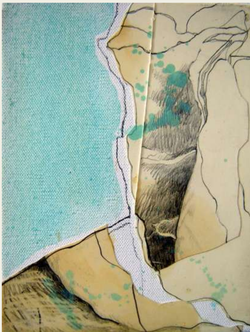
©Dindart G. Collages et peinture à l'huile sur toile, « corps-paysages » esquisse pour une étoile - 2010.

« Accompagner et Soutenir la Création et les Médiations Artistiques en Travail Social et Médico-social »